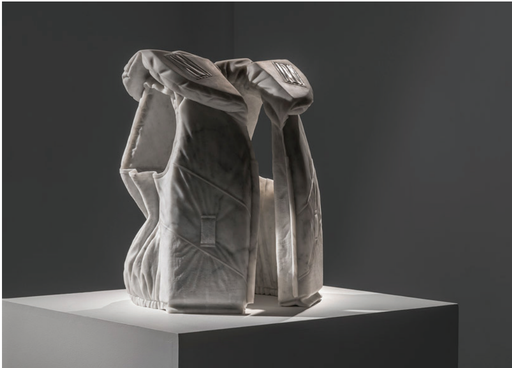
Life vest (Emergency) , 2014 Bianco Carrara marble 50 x 32 x 25 cm