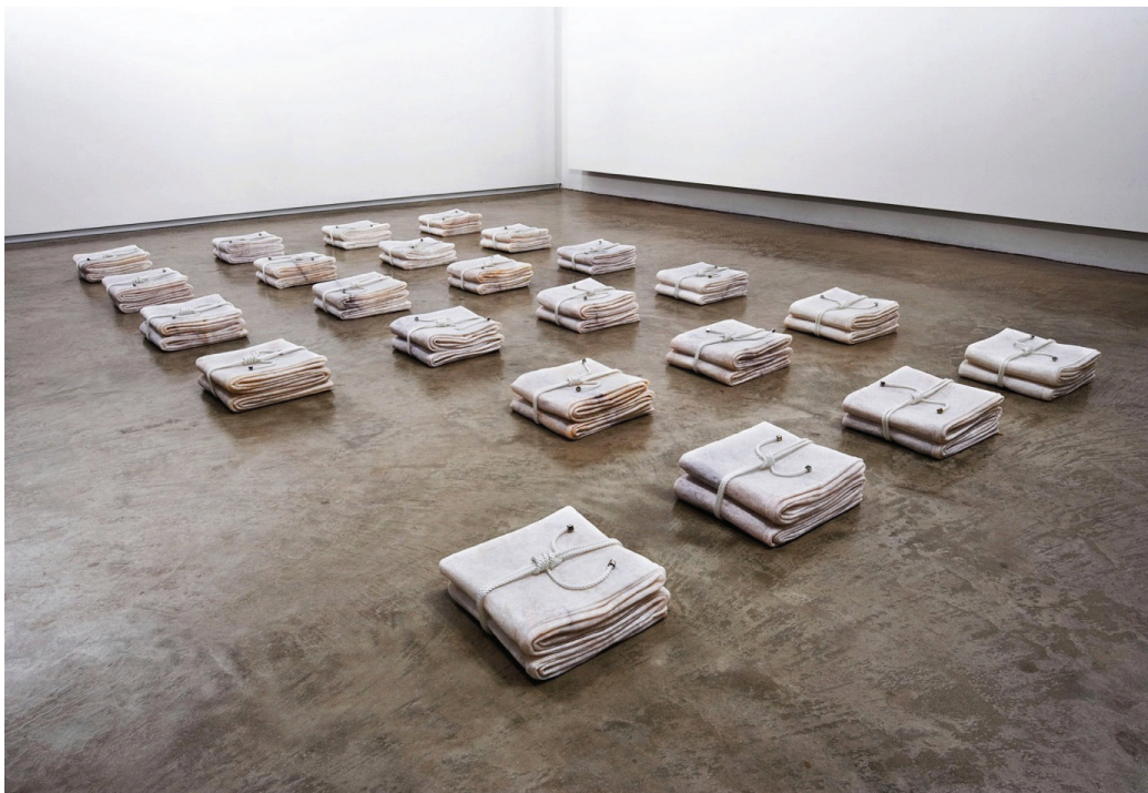
As of Today , 2011 QLD marble, halyard, Dimensions variable