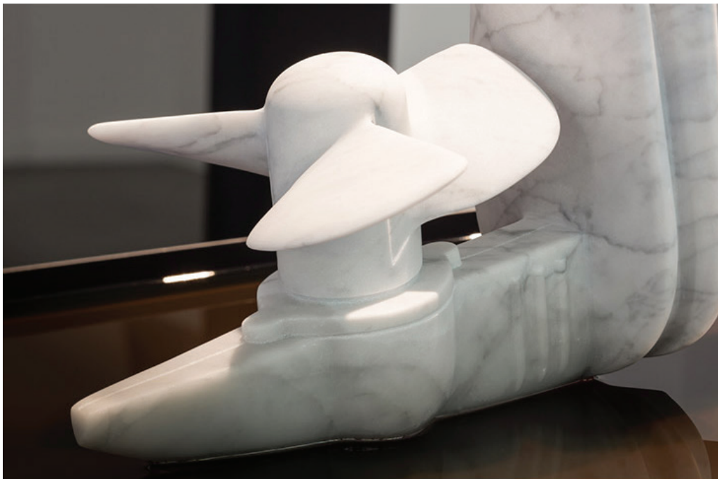
Detail Oilstone 01: Transparent , 2015 Bianco Carrara marble, engine oil