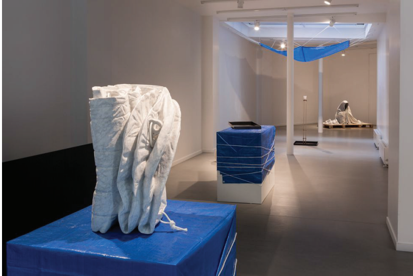
Vue de l'exposition. ➔ f (h) tq

reproduisant dans le marbre les objets de leur quotidien.