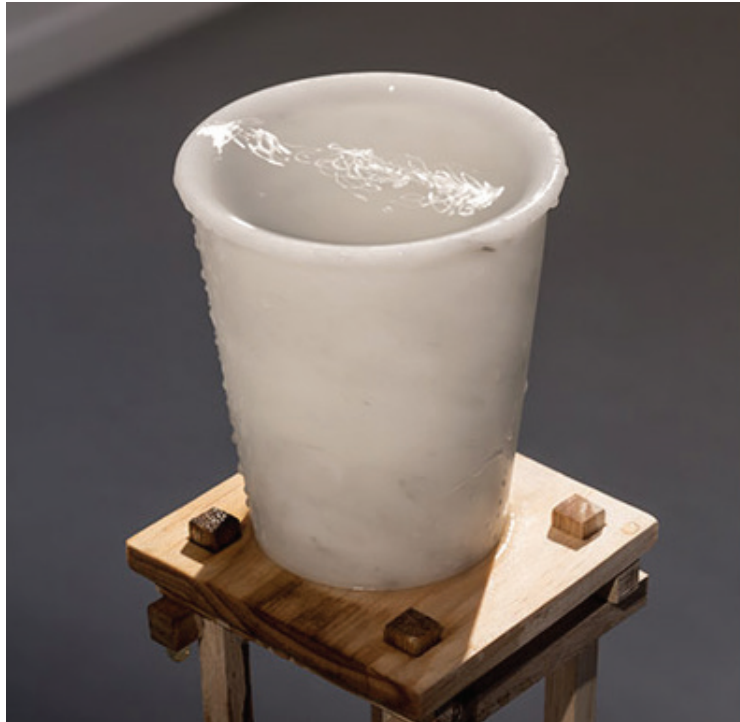
Detail Deluge in a Cup , 2015 Bianca Carrara marble, water 30 x 27 x 14 cm