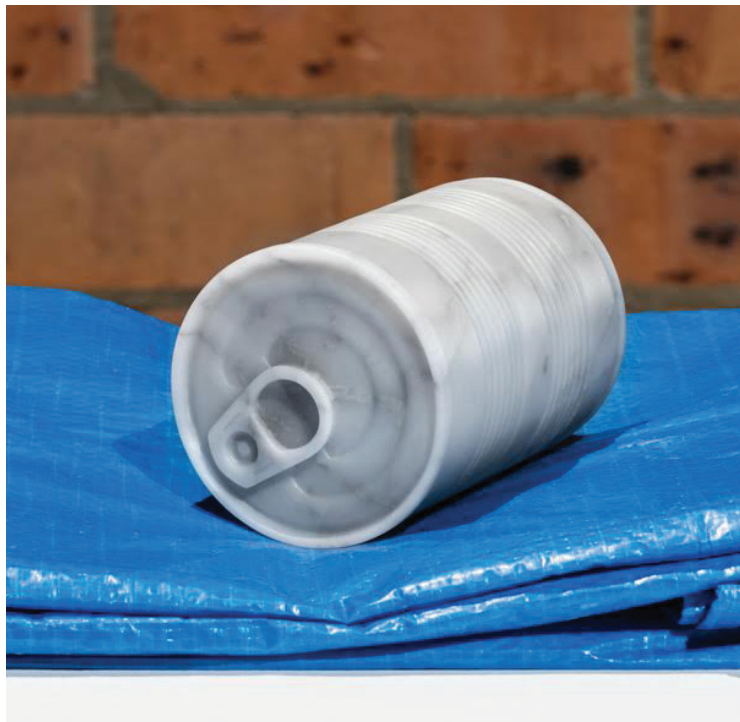
Oil Can 01 , 2015 Bianca Carrara, tarp 40 x 27 x 10 cm