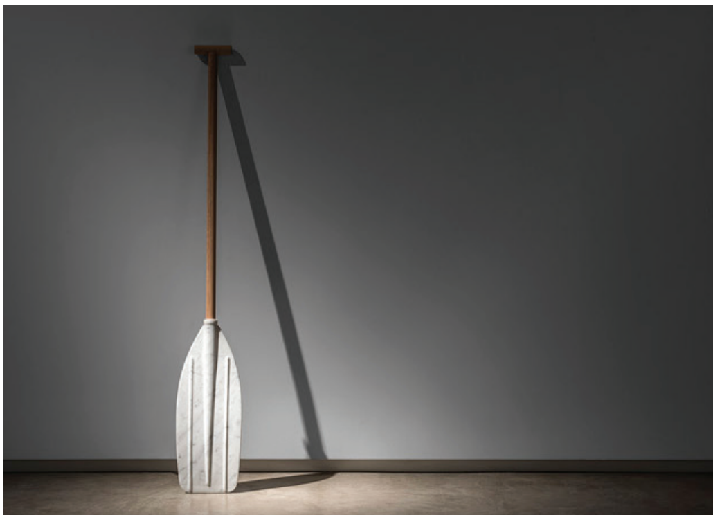
A paddle... , 2014 Wood, bianca carrara marble 125 x 18 x 4 cm