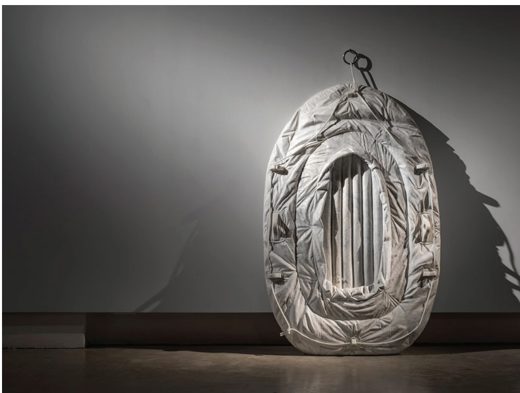
Durable solutions 01 , 2014 Wombeyan marble, polyester ropes, spigots 140 x 95 x 12 cm