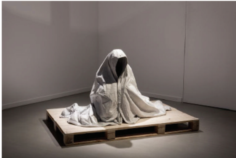
Alex Seton, Refuge , 2015.

Les bateaux ne sont pas encore gonflés, ils sont présentés encore pliés, d'un hyperréalisme époustoufflant, les plis et la matière propres au textile paraissent souples et contrastent étonnamment avec la solidité de la pierre, dans laquelle l'artiste a même incrusté les cordages de nylon ou une valve de gonflage.