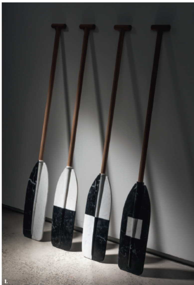
1. Alex Saxon, ELI LILY , 2015. Wood, Yucca block, marble and limestone marble, each 188 x 18 x 4cm. www.alex-saxon.com , courtesy

Alex Saxon exhibits with Sullivan + Strumpf, stand 2012 at Art Basel Hong Kong 2015.