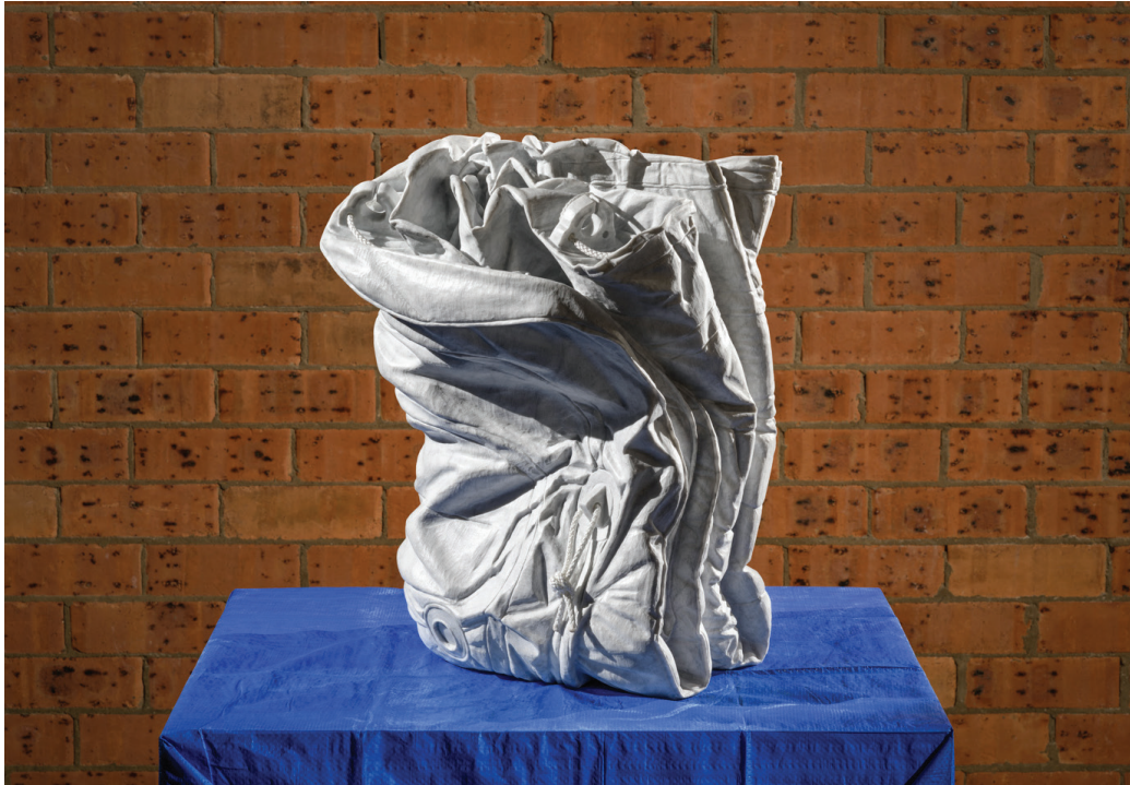
Folded Zodiac 01 , 2015 Bianca Carrara marble, tarp, rope, spigot 56 x 42 x 35 cm