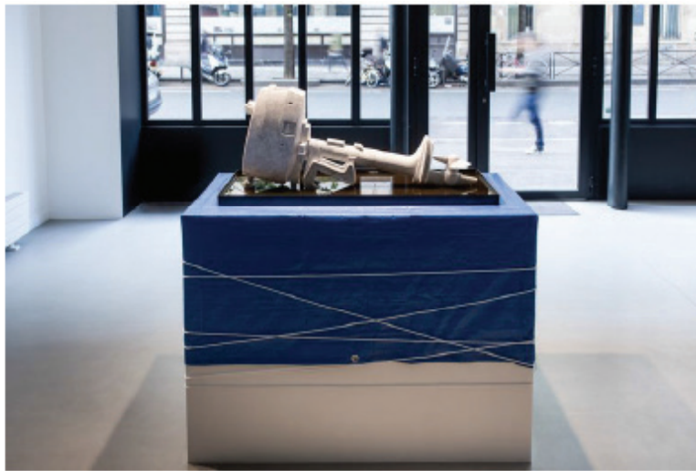
Alex Seton, Oilstone 01: Transparent , 2015.

Depuis, plus aucun boat people, la plupart originaire du Sri Lanka, d'Iran, d'Irak, d'Afghanistan ou du Vietnam, n'est désormais accepté dans les eaux territoriales. Les migrants arrêtés en mer ont le choix entre retourner dans leur pays d'origine ou être transférés en centre de détention offshore, c'est-à-dire hors du territoire dans des pays partenaires.