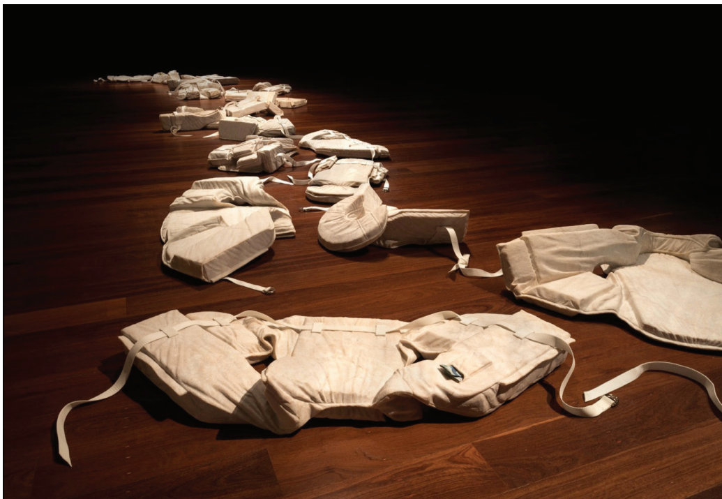
Someone died trying to have a life like mine , 2013 Wombeyan marble, nylon webbing Dimensions variable