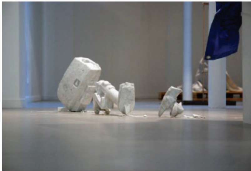
© Anne-Frédérique For, visite de l'exposition, le 10 septembre 2015.

texte de Sylvain Silleran, rédacteur pour FranceFineArt.