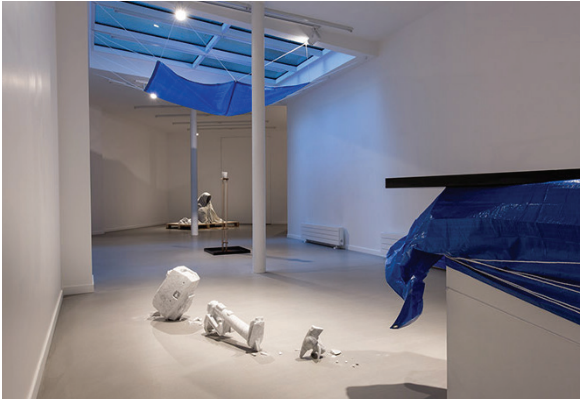
THE JOURNEY Solo Show September 10th - October 24th 2015 Galerie Paris-Beijing, Paris