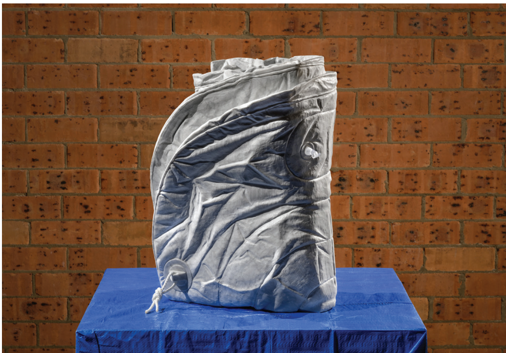
Folded Zodiac 02 , 2015 Bianca Carrara marble, tarp, rope, spigot 56 x 42 x 35 cm