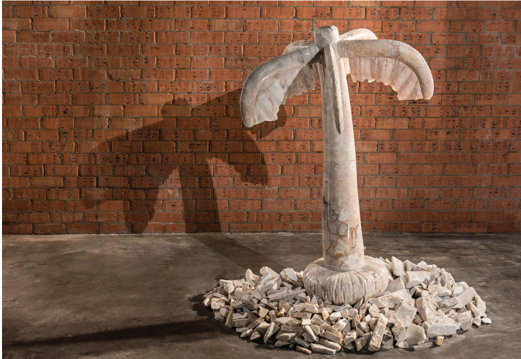
Last resort , 2014 Wombeyan marble Dimension variable