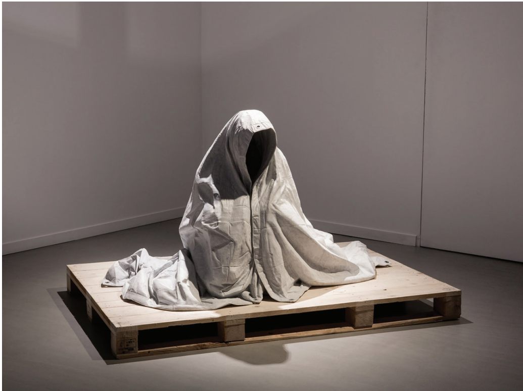
Refuge , 2015 Bianca Carrara marble, tarp, eyelets 110 x 120 x 170 cm