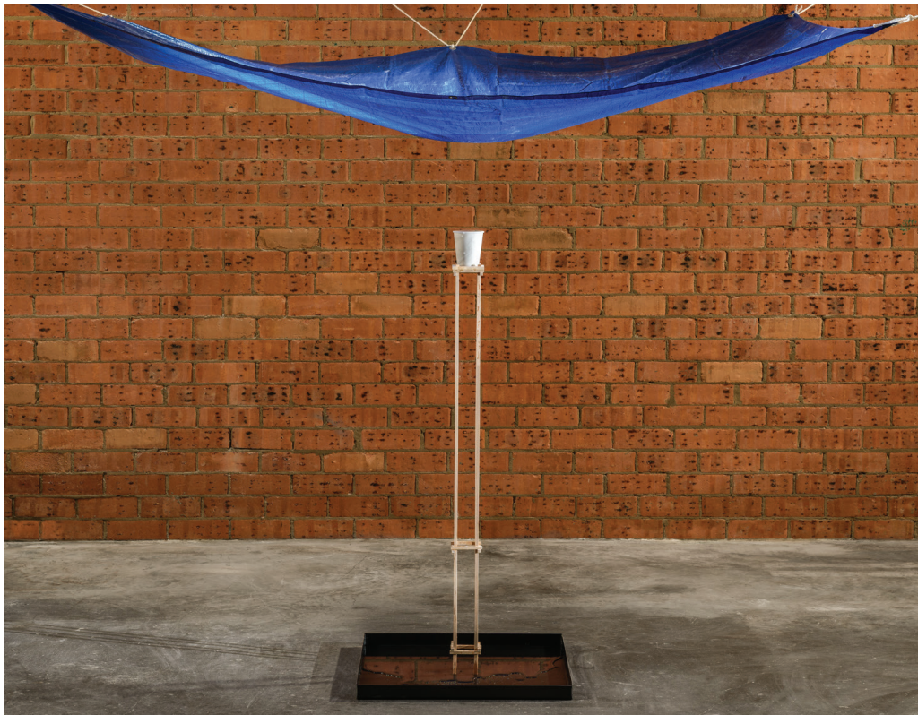
Deluge in a Cup , 2015 Bianca Carrara marble, tarp, water, steel Installed dimensions variable