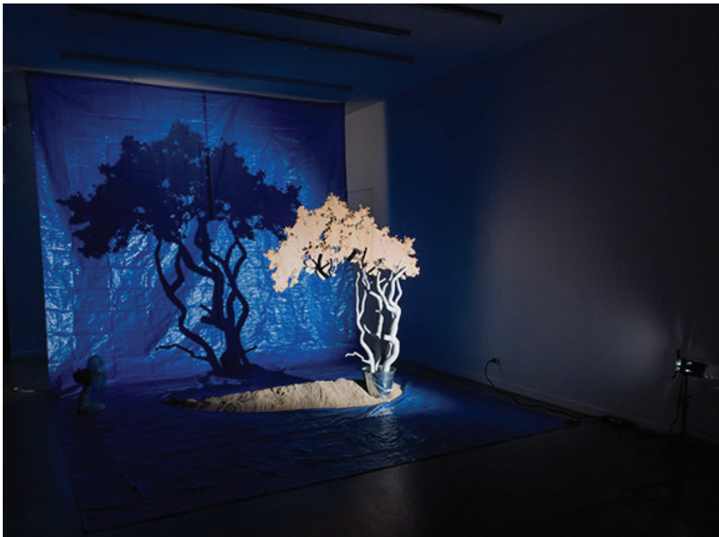
The Best of All Possible Worlds , 2015 Bianca Carrara marble, tarp, tin, bucket, sand, light Installed dimensions variable