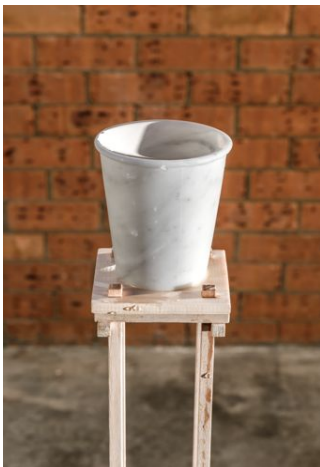
Deluge in a Cup 2015 Marbre blanc de Carrare, bâche, eau, acier inoxydable Installation, dimensions variables