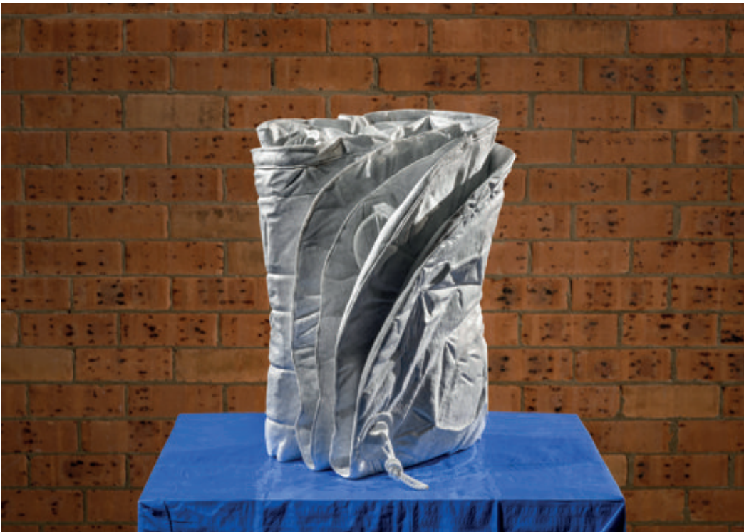
Folded Zodiac 01 , 2015