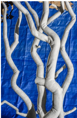
The Best of All Possible Worlds , 2015 Marble blanc de Carrare, bâche, seau, sable Installation, dimensions variables