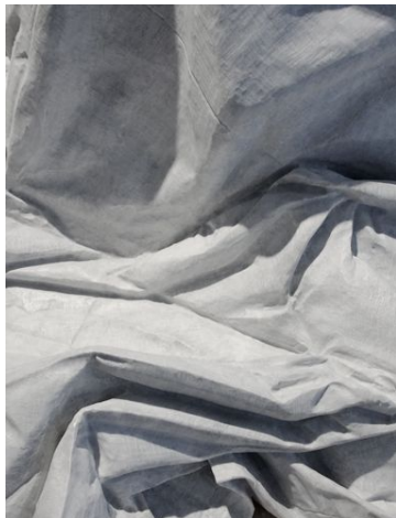
Refuge , 2015 Marbre blanc de Carrare, bâche, œillets 110 x 120 x 170 cm