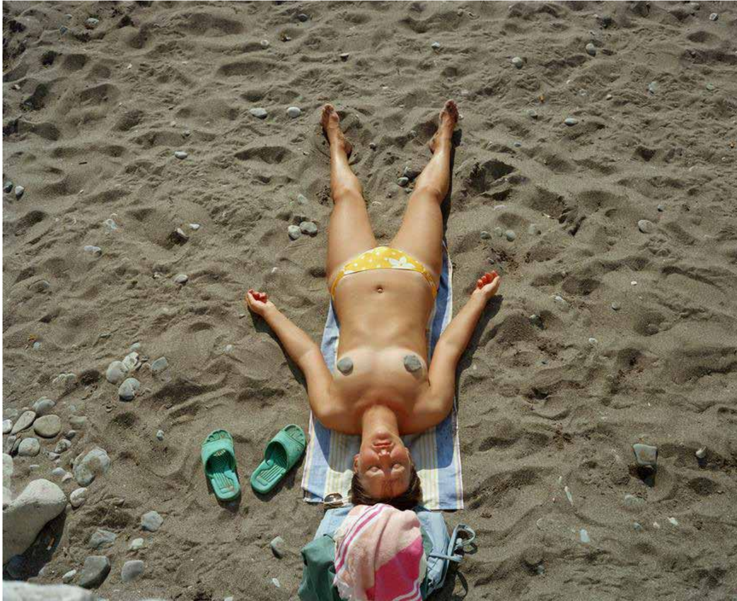
LON3739, Ukraine, Yalta.1995.

GALERIE PARIS-BEIJING PARIS - BRUSSELS - BEIJING