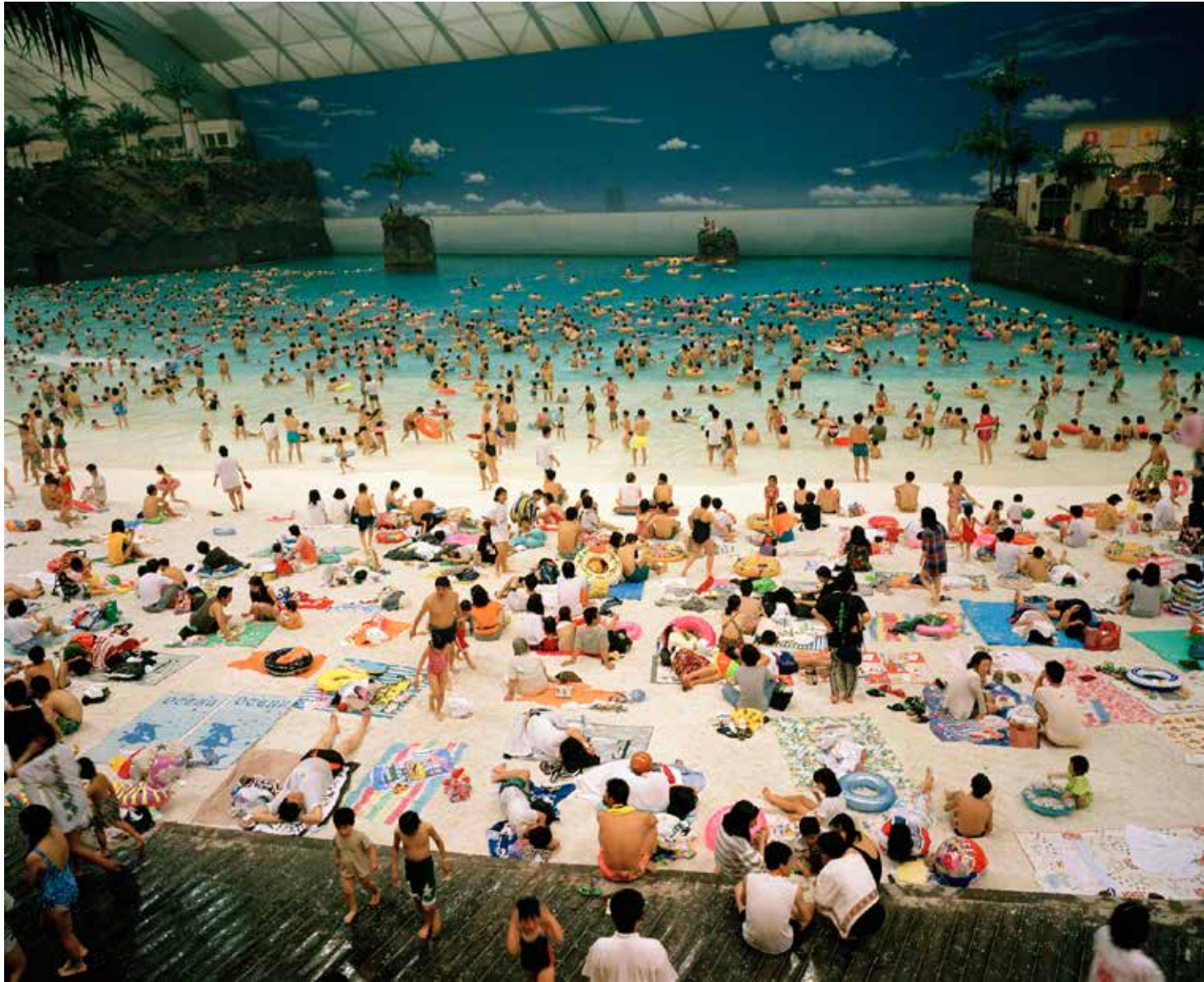
LON14581, Japan, Miyazaki. The artificial beach inside the Ocean Dome. 1986