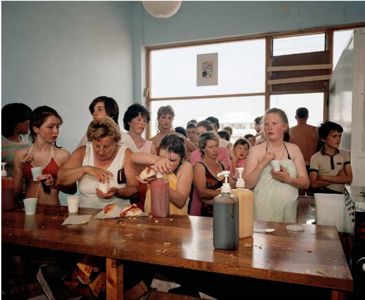
LON6918, England, New Brighton. 1983-85

GALERIE PARIS-BEIJING PARIS - BRUSSELS - BEIJING