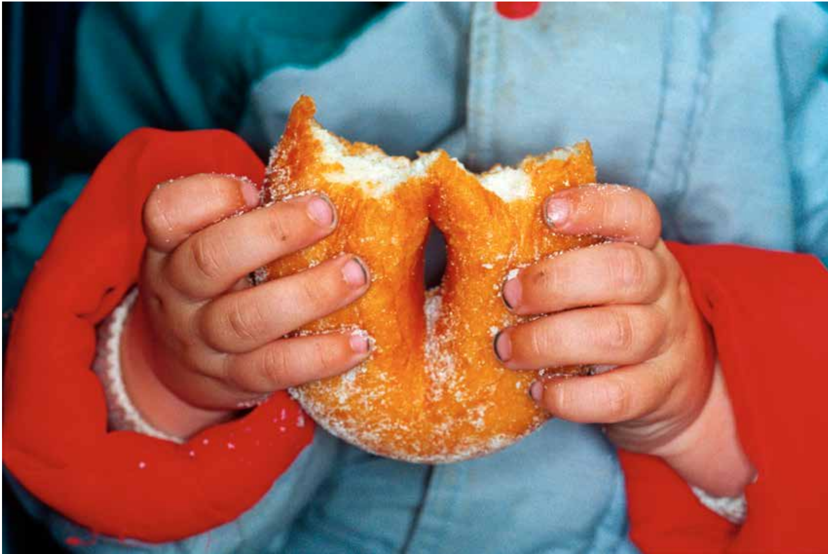
LON4841, England, New British, Ramsgate. 1996.

GALERIE PARIS-BEIJING PARIS - BRUSSELS - BEIJING