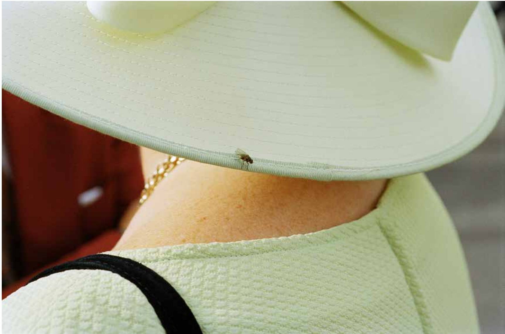
LON29302, Ireland, Galway, Galway Races. 1987

GALERIE PARIS-BEIJING PARIS - BRUSSELS - BEIJING