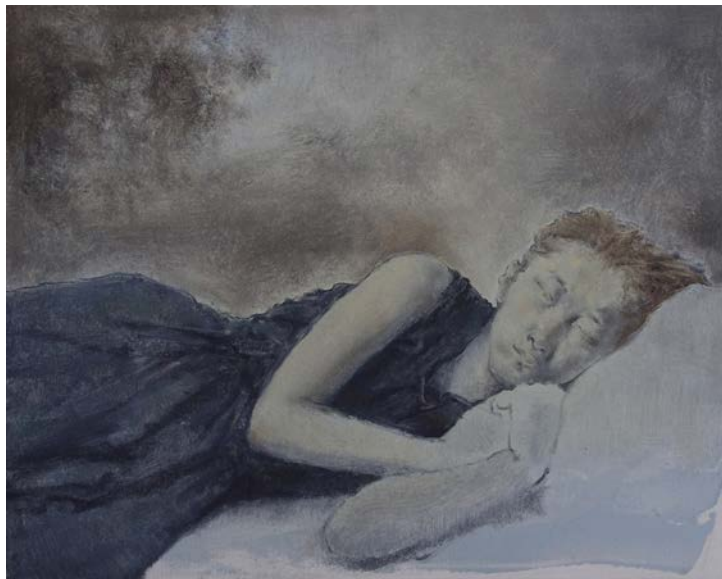
Dream , 2013 Huile sur toile 30 x 50 cm