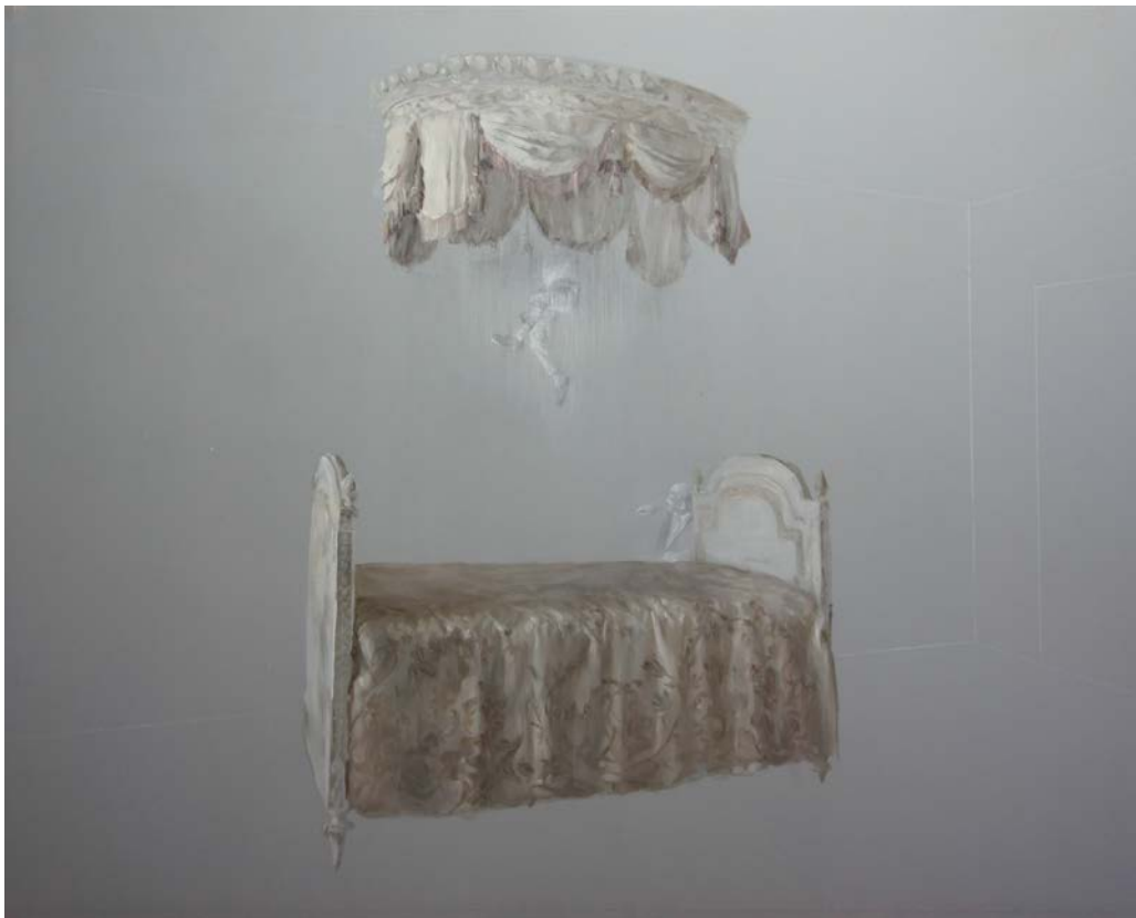
Politicians, Bedroom scene, 2015