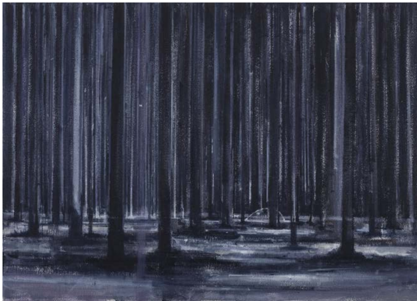
Turbid Landscape, Untitled, 2014 Huile sur toile 50 x 70 cm

L'onirisme de Zhu Xinyu plonge dans les méandres de paysages et forêts enchantées. Ses larges peintures à l'huile amènent les spectateurs dans les ombres et les lueurs d'étranges crépuscules et lumières éthérées qui traversent les arbres. Ecologie mystique et œuvre hypersensible, Zhu Xinyu n'aborde en aucun cas le paysage de façon romantique mais symbolique. Si la forêt est capable d'évoquer la parenté entre les ténèbres, la lumière et le corps, elle est ici lieu de réminiscence et de méditation, à l'abri du fracas du monde.