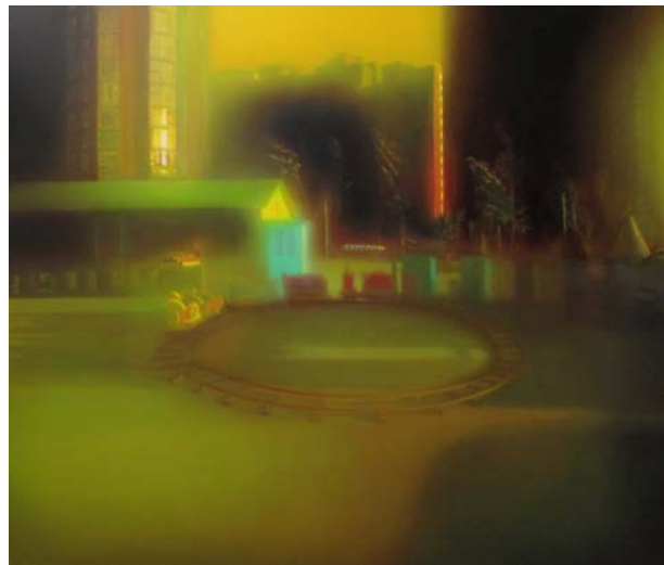
Gardens, Edge of the City, 2012 Huile sur toile 170 x 200 cm

La lumière est aussi l'élément primordial des toiles de Ma Sibó. Telles de fenêtres de l'esprit, elles nous donnent à voir des fragments de paysages intimes et de bribes du quotidien aux pouvoirs évocateurs. Les jeux de lumière et de flou, obtenus grâce à un étonnant travail de la matière en dégradé, recouvrent des scènes et des espaces banals d'un effet troublant d'étrangeté. Dans ces lieux épurés de toute présence humaine, les sensations sont confiées aux choses et aux couleurs. En effet, les pinceaux de Ma Sibó entourent des objets inertes d'une aura émotionnelle, en réveillant une nostalgie vague ou des souvenirs estompés.