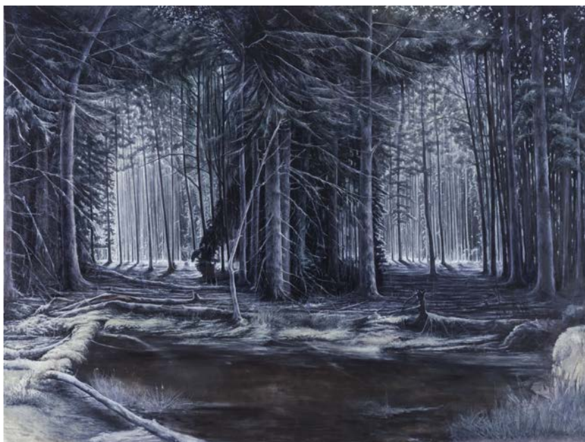
Turbid Landscape, Grace, 2014 Huile sur toile 240 x 320 cm