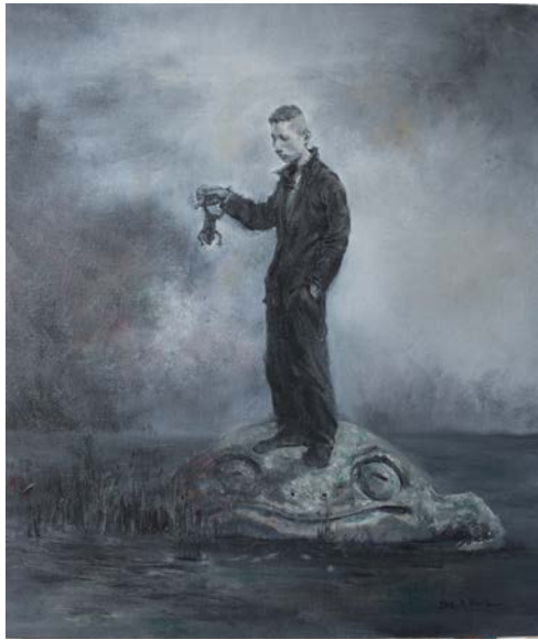
Five elements - Water poisoning , 2012 Huile sur toile 70 x 60 cm

L'étude de l'être humain et ses vicissitudes caractérise les portraits à l'huile de Sun Yu. Utilisant une palette minimale et un coup de pinceau soigné, il représente des personnages tourmentés qui semblent être à la recherche du sens de leur propre existence. Les expressions de leurs visages et leurs silhouettes fragiles nous renvoient à des sentiments d'aliénation et d'inquiétude.