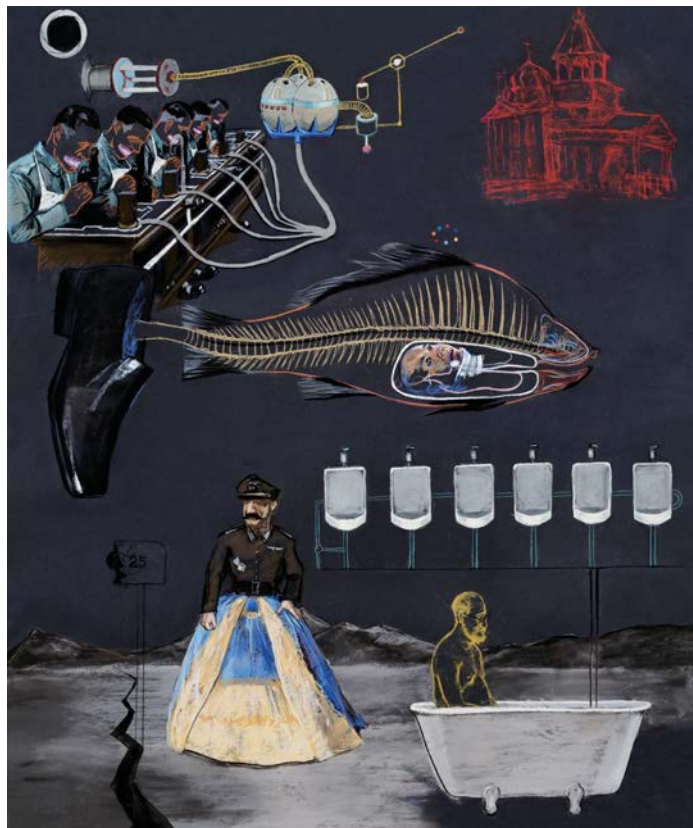
Freud, Fish and butterfly , 2012 Vidéo + Pastel sur papier 03'27"