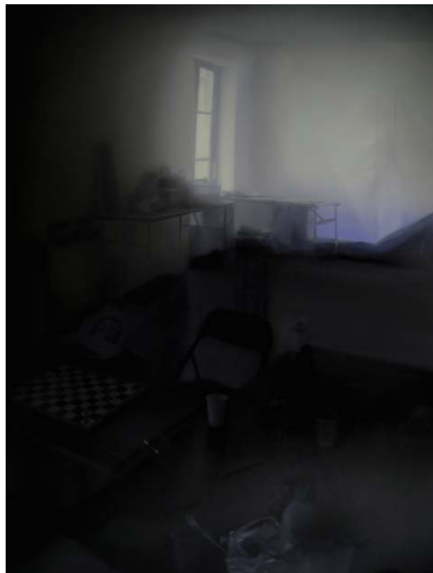
Interiors, School Holidays, 2010 Huile sur toile 170 x 230 cm