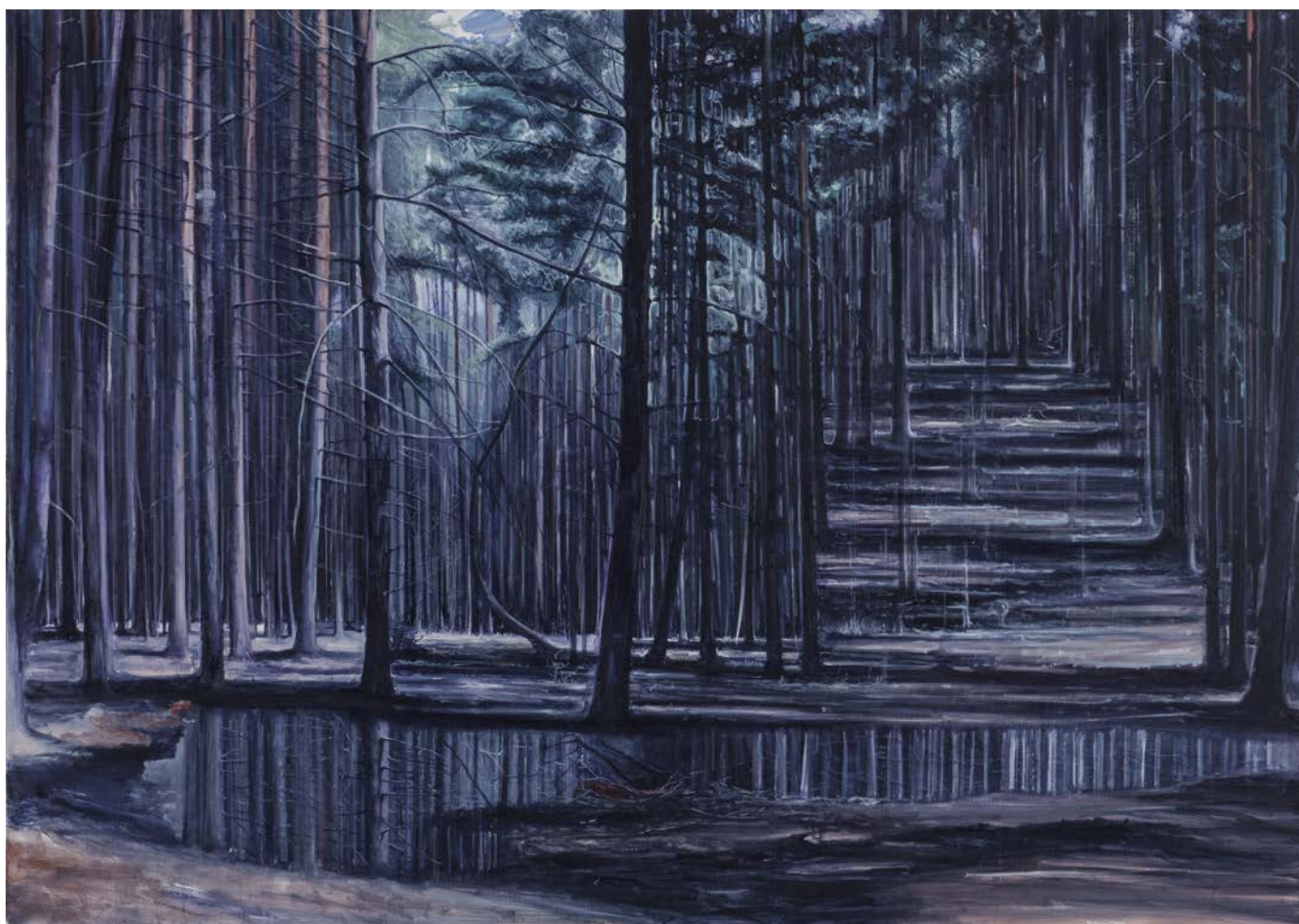
Zhu Xinyu Turbid landscape, Mountains, 2014 Huile sur toile 120 x 170 cm