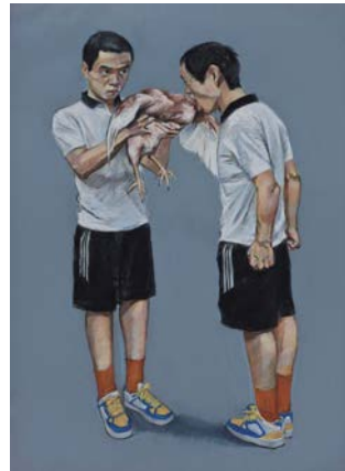
Untitled 02, 2010 Pastel sur papier 75 x 55 cm