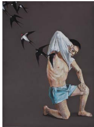
Untitled 22, 2010 Pastel sur papier 75 x 55 cm

L'œuvre du peintre et vidéaste Wang Haiyang porte plus explicitement sur les états du subconscient et explore ses relations les plus tortueuses avec le désir. Ses personnages très kafkaiens se transforment et se métamorphosent, alors que des images énigmatiques nous mettent face à des émotions dérangeantes. Les œuvres de Wang Haiyang manifestent les formations de l'inconscient à ciel ouvert comme l'illustre, par exemple, la figure de Freud dont le crâne s'ouvre pour laisser s'échapper des papillons ( Freud, Fish and Butterfly , 2012).