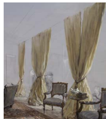
Politicians, Bedroom scene, 2013

Technique sur papier marouffé sur toile 80 x 130 cm