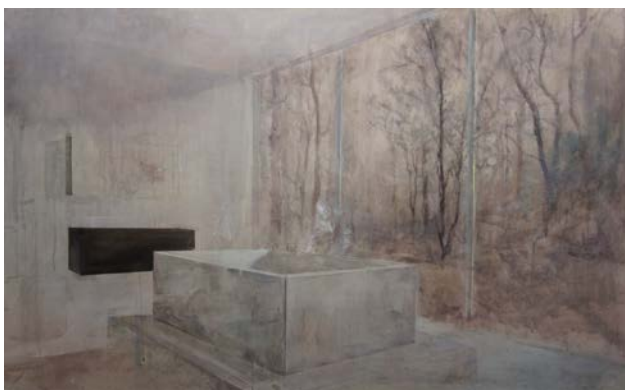
Politicians, Pool scene, 2014

Technique sur papier marouffé sur toile 110 x 120 cm