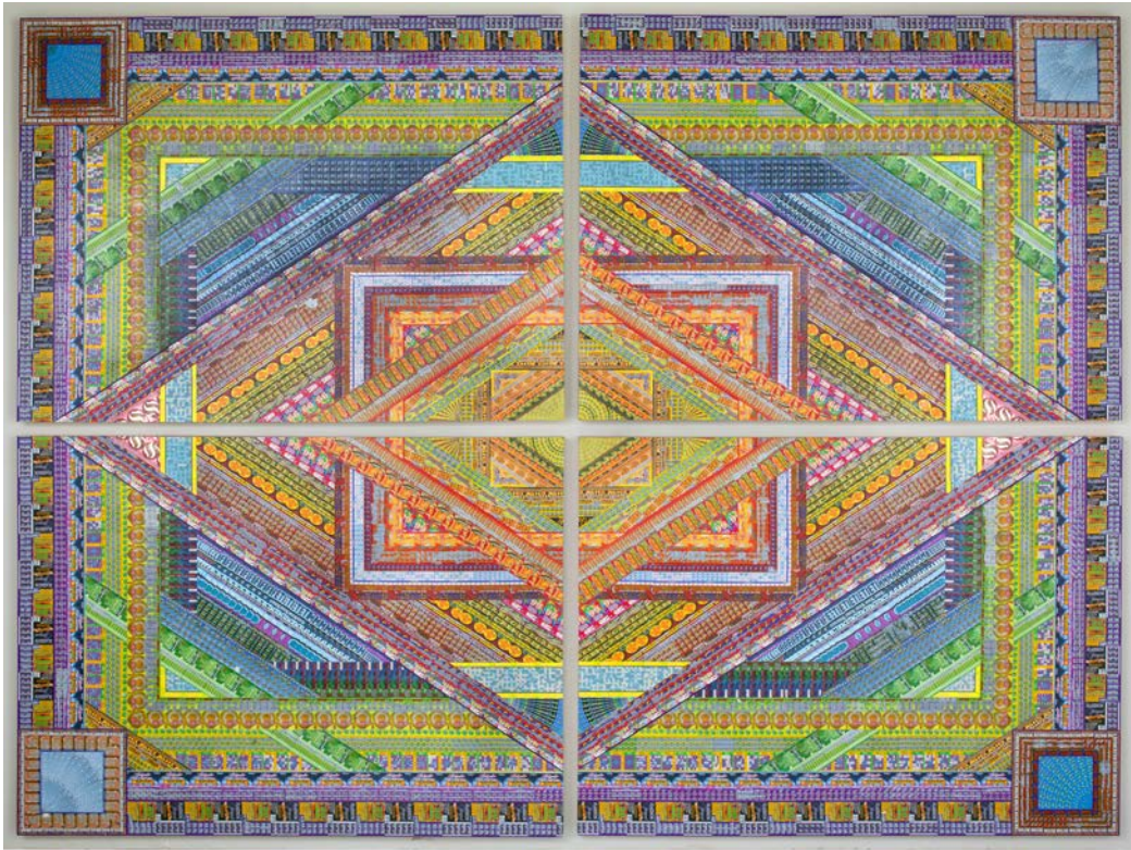
End of spectrum , 2011, 233 x 310 cm, tickets de loterie glanés collés sur panneau de bois