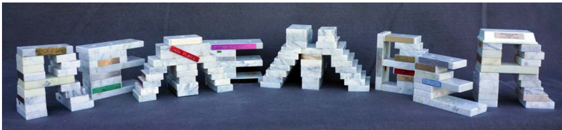
Remember , 2011, 21 x 158 x 32 cm, socles de trophées en marbre