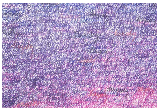
Détails : Tragedy sunset