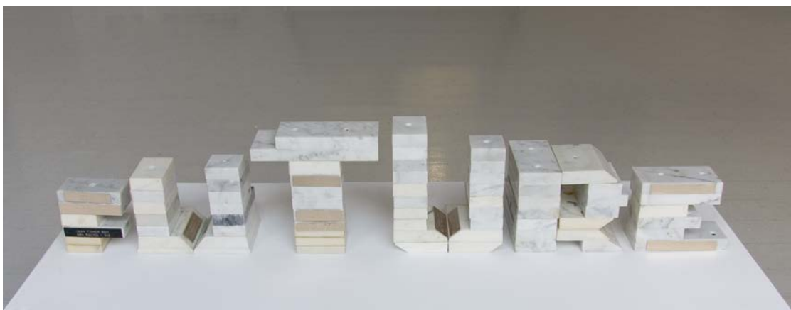
Futur , 2011, 20 x 114 x 17 cm, socles de trophées en marbre