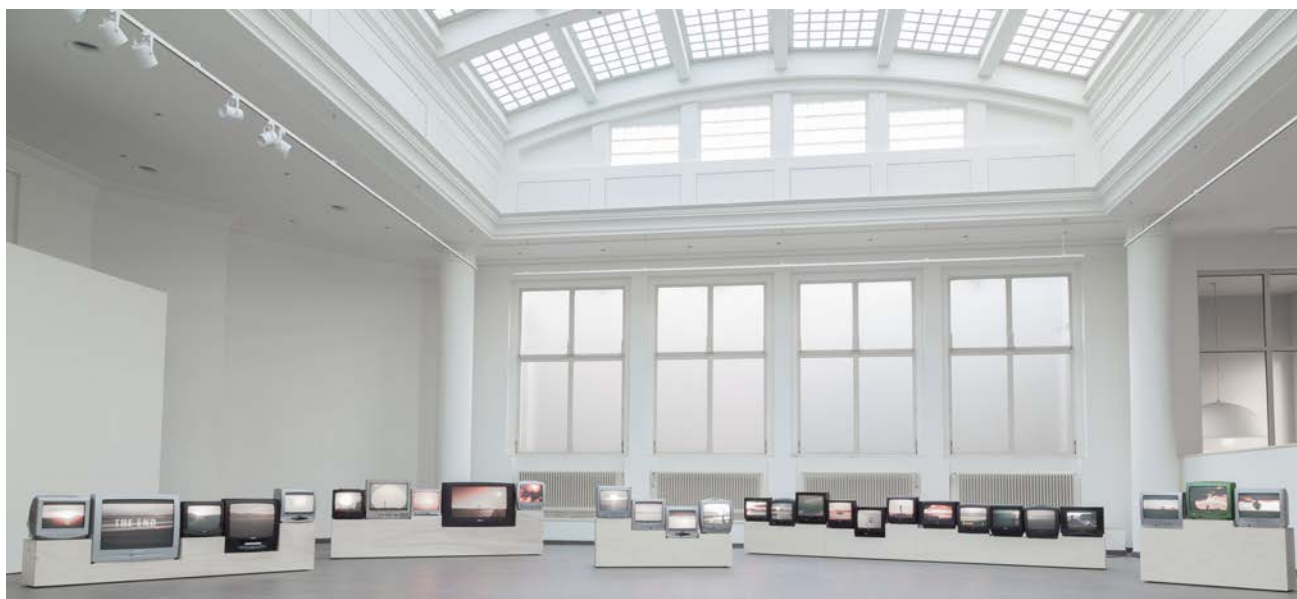
Day is done , 2013, installation vidéo constituée de 28 téléviseurs

Day is Done est une archive digitale constituée de couchers de soleil collectés dans des films hollywoodiens. La scène du coucher de soleil est ici organisée par couleur et sujet. Les téléviseurs sont reliés entre eux grâce à l'alignement de l'horizon présent dans chacune des vidéos. Le coucher de soleil est synonyme de changement, d'espoir et de romance. C'est le moment où la nuit prend place et le jour s'éteint.