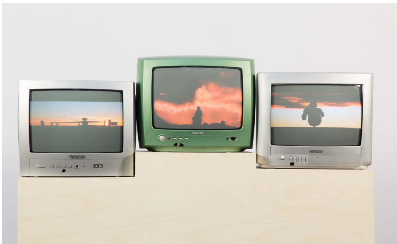
Don't let the sun gown on me issu de la série Day is done , 2013, 97 x 111 x 39 cm, téléviseurs et technique mixte

Day is Done est une archive digitale constituée de couchers de soleil collectés dans des films hollywoodiens. La scène du coucher de soleil est ici organisée par couleur et sujet. Les téléviseurs sont reliés entre eux grâce à l'alignement de l'horizon présent dans chacune des vidéos. Le coucher de soleil est synonyme de changement, d'espoir et de romance. C'est le moment où la nuit prend place et le jour s'éteint.