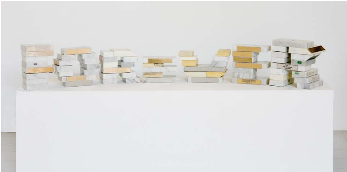
Forever , 2011, 17 x 107 x 29 cm, socles de trophées en marbre