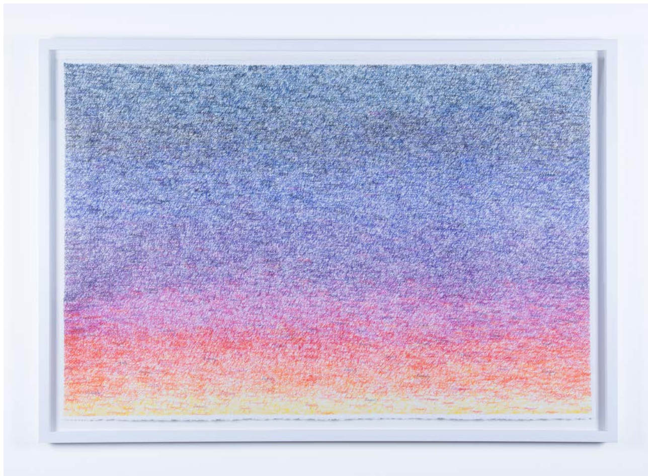
Tragedy sunset , 2013, 67 x 100 cm, encre sur papier