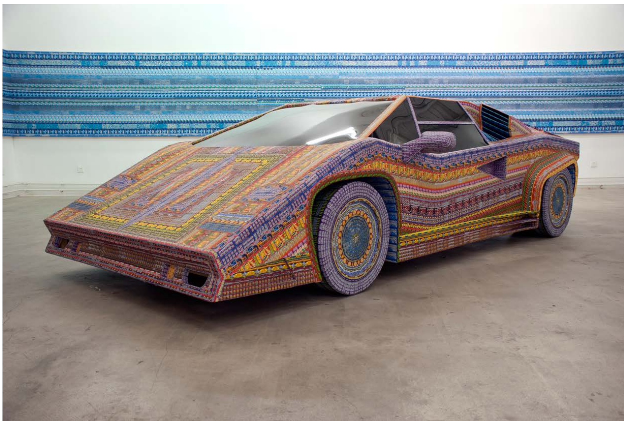
Dream ride , 2010, 110 x 220 x 414 cm, bois, plexiglass et tickets de loterie glanés

Vernissage samedi 7 février de 18h00 à 21h00