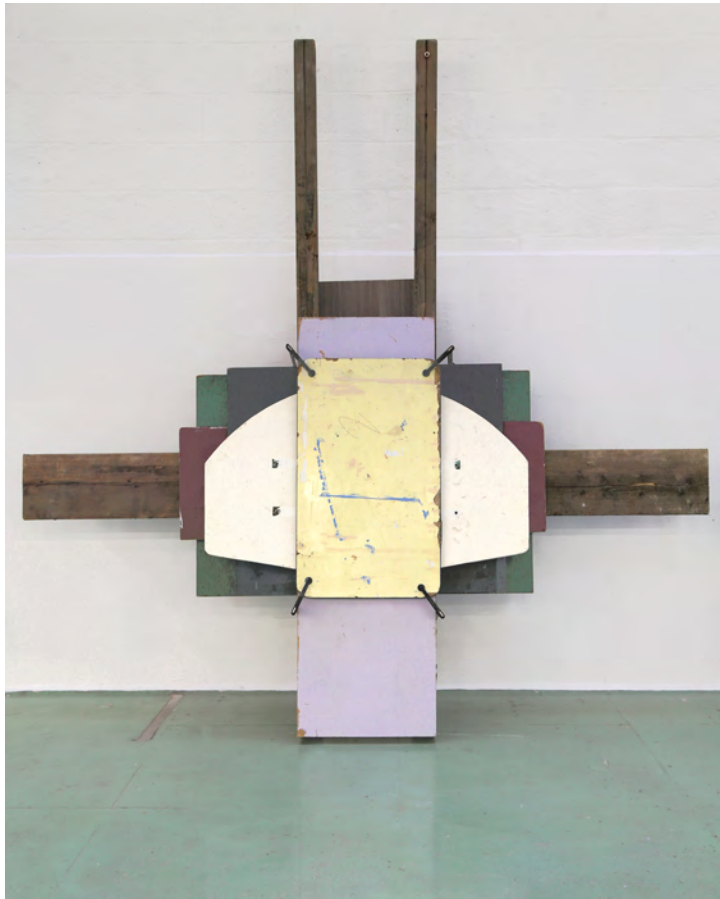
Composition Empirique 06, 2017, boards and clamps, dimensions variable

Karim Ghaddab (excerpt from the text "Because I have to do something" September 2017)