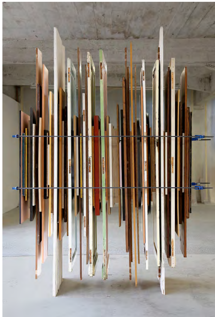
Dig-Up, 2017, boards and clamps, dimensions variable © Claude Cattelain / Courtesy Galerie Paris-Beijing

His work is part of the many institutional collections such as Cnap (Centre national des arts plastiques), Frac Languedoc-Roussillon, Musée des Beaux-Arts d'Arras, Musée des Beaux-Arts de Calais.