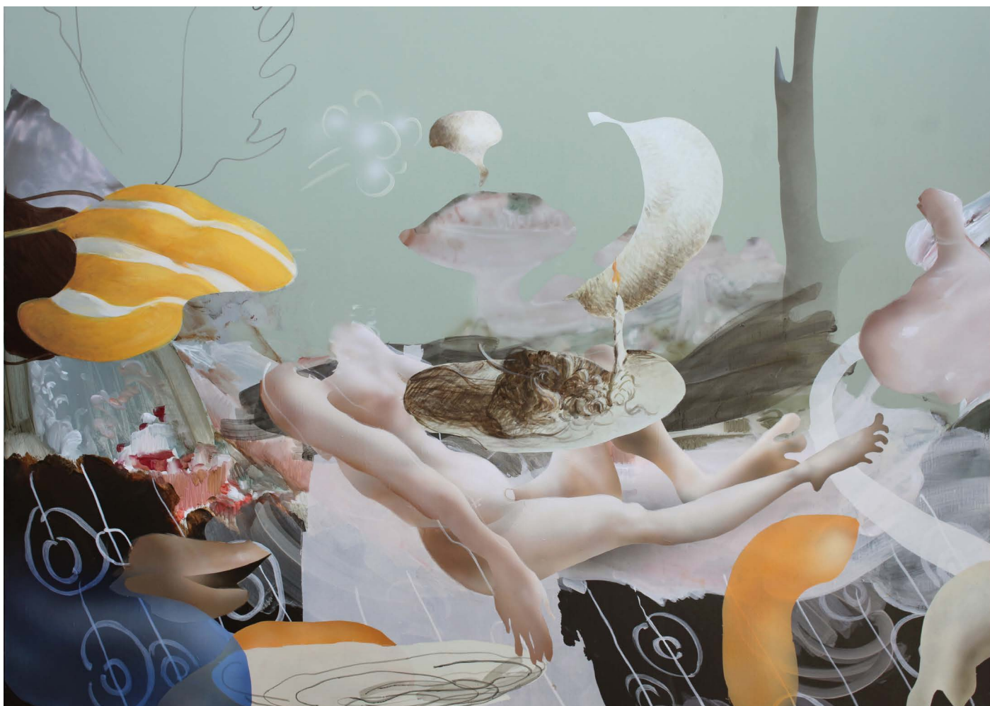
Nude, 2021, Acrylic sur toile, 90 x 116 cm

Tout, dans ces images, lesquelles associent des êtres humains et non humains dans une sphère extraplanétaire d'apesanteur et donnent vie à des relations mystérieuses entre des objets innommables ou nommables qu'à moitié, tout donc semble avoir égale valeur. Point de hiérarchie. Sous nos yeux, des formes à la fois transparentes et opaques, comme faites de verre, semblent danser, se mêler, s'enlacer et se fondre les unes dans les autres pour mieux se séparer. Une forme nébuleuse, encore amorphe, se transforme sous notre regard en une mâchoire d'animal qui pourrait tout aussi bien être un cheval avec queue au galop qu'un monstre sorti d'un univers de science-fiction ; ou encore ce bras humain tendu vers le ciel dépassant d'une forme rouge, sorte de vêtement, nous donnant l'impression d'apercevoir un personnage sans tête. D'autres formes font songer à une aile, nous rappelant les vaines tentatives de vol d'Icare. Et une « femme en noir », la main droite ouverte, se tient debout dans une pièce vide où des formes abstraites volent comme des oiseaux.