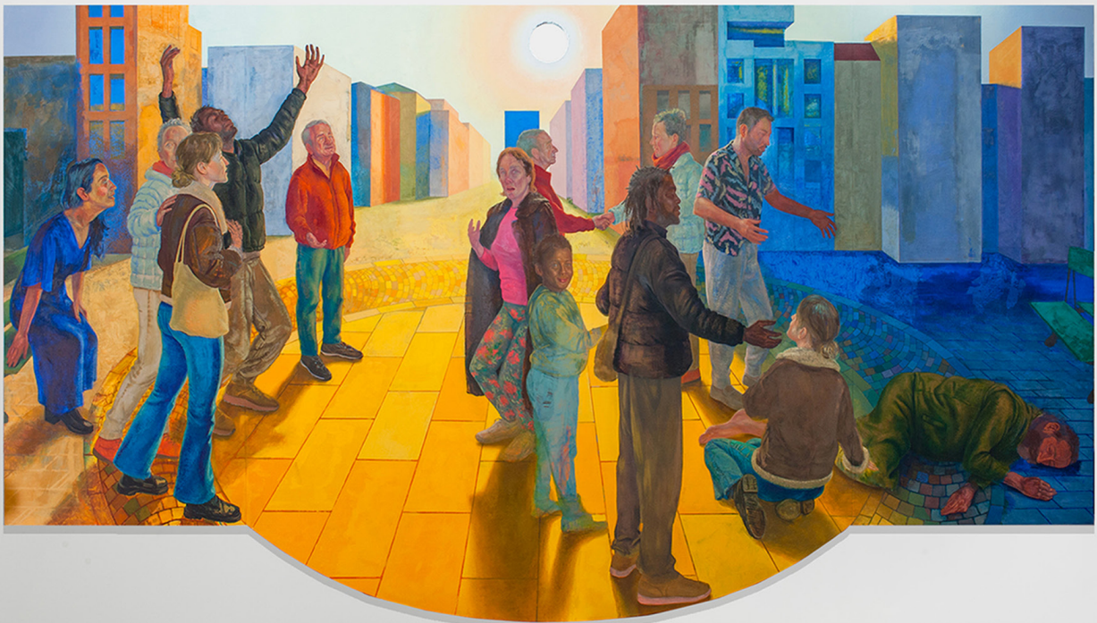
Place de la Réunion , 2023. Tempera sur bois, 213 x 400 cm