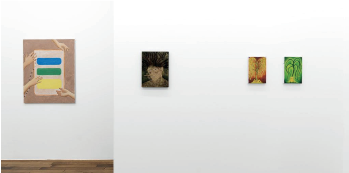
Vue de l'exposition collective Figurative Painting in France Today (selection) , galerie Peter Kilchmann, Paris, 2023

On achèvera ce parcours de rentrée sur la double proposition de la galerie Templon, où l'acérbe le dispute à la lucidité. D'un côté, le dernier opus de Jonathan Meese (Templon Beaubourg, jusqu'au 28 octobre) qui reticote ici son propre récit familial avec ceux des contes de fées de son enfance. Son grotesque ne tient pas que du Grand-Guignol ou de la blague potache, mais bien des circonvolutions d'une pensée en action qui nous livre, certes avec crudité, tous ses errements et toutes ses jouissances. Au-delà d'une fascination revendiquée pour la culture américaine et d'une écriture picturale ou sculpturale hyperréaliste, Robin Kid (Templon Grenier Saint Lazare, jusqu'au 21 octobre) nous invite également à revisiter sa propre histoire. Sous les apparences d'un train fantôme ou d'une cabane recluse en forêt profonde, il y a là des secrets enfouis qui se révèlent aujourd'hui avec fulgurance et intensité, en particulier l'occupation des Pays-Bas par le pouvoir nazi, puis l'arrivée des soldats américains comme libérateurs. Entre traumatismes et légendes familiales, des images de vie s'articulent et s'interchangent, tout en faisant écho à notre monde actuel. L'exercice est virtuose et plutôt stupéfiant. Il nous est délivré là encore tel que. À nous de nous en dépêtrer.