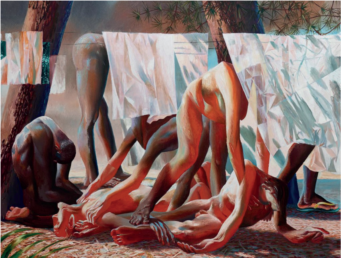
Laurent Proux, The Escape , 2023, huile sur toile