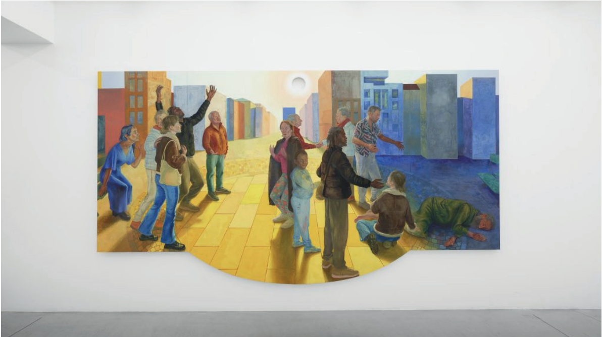
Vue de l'exposition Marion Bataillard, Notre corps , galerie Paris-B, Paris, 2023, Ph. Théo Baulig, Court. l'artiste et Paris-B

souvent périlleux, Marion Bataillard le remporte haut la main chez Paris-B (jusqu'au 21 octobre). Ses figures à la tempera y sont plus solaires que simplement hiératiques, ses compositions plus troublantes que seulement savantes. Elle sait en effet générer de l'inquiétude au-delà de la perfection de son écriture picturale. Dans un autre registre, celui de l'expressionnisme radical, les peintures récentes de Ludivine Gonthier, présentées par Yes We Love (jusqu'au 30 septembre), ont un mordant et une acidité plutôt bienvenus.