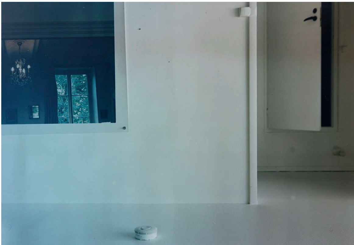
© Baptiste Rabichon, Mother's Rooms, 2022

La onzième édition du Prix Camera Clara, qui vise à récompenser les artistes qui travaillent à la chambre photographique, vient d'être décerné au photographe français Baptiste Rabichon pour sa série « Mother's Rooms ». Le travail primé est actuellement exposé jusqu'au 30 juin, au Studio Frank Horvat à Boulogne Billancourt. À Paris, c'est la galerie Binôme qui propose de découvrir d'autres travaux du lauréat avec l'exposition « Verbatim », visible jusqu'au 20 mai. La remise de ce prix est également l'occasion de présenter la sortie de l'ouvrage qui célèbre les 10 ans du prix et permet de revenir sur les lauréat-es entre 2012 et 2022.