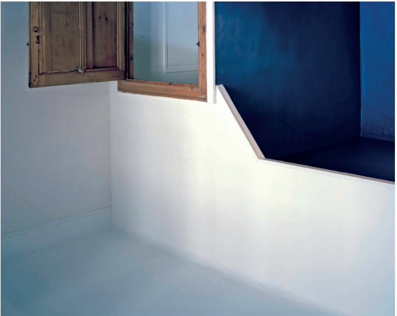
Mother's Rooms, 2022